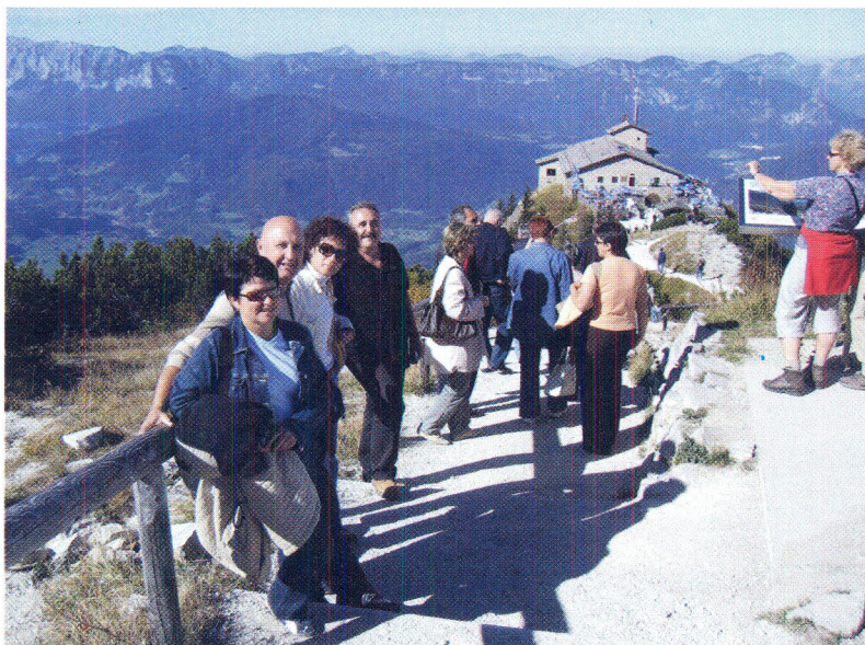
Slika 9. Orlovo gnijezdo – veličanstven ugođaj.

Ručali smo u ovom planinskom restoranu i nastavili ugodnu vožnju prema Zagrebu.