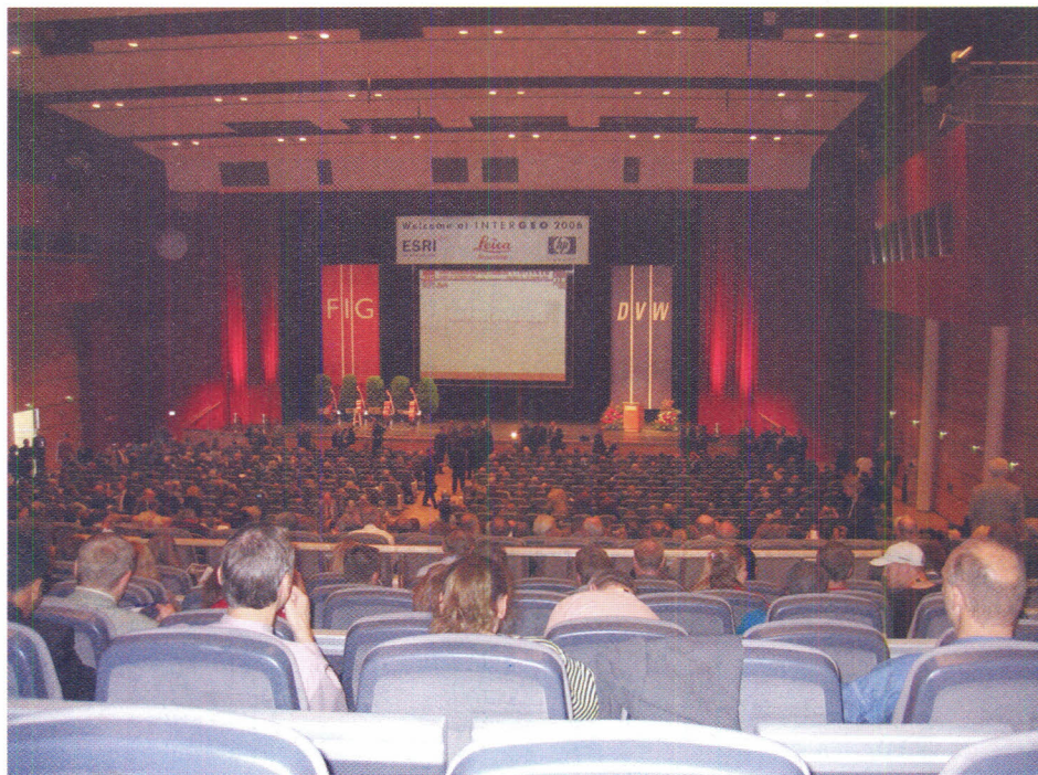
Slika 1. Dvorana kongresnog centra povodom otvaranja Kongresa FIG-e.

U ponoć 10. listopada, iz Zagreba je autobusom Generalturista put do Münchena vodio preko Slovenije i Austrije. Uz kraća zadržavanja doputovali smo do Novog Münchenskog sajma gdje se izvršene pripreme za svečano otvaranje Kongresa FIG-e i sajma INTERGEO.