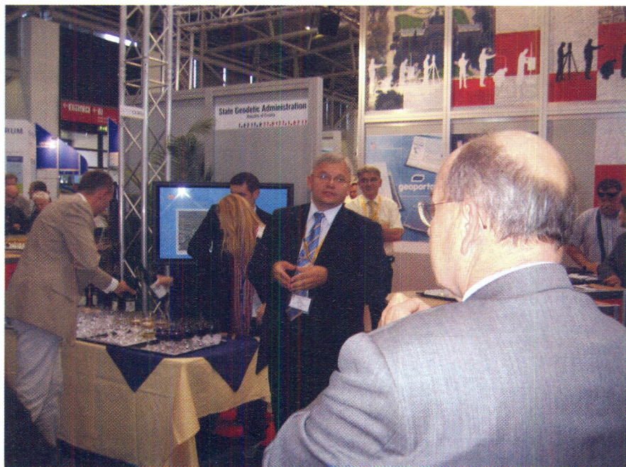
Slika 3. Prof. dr. sc. Željko Bačić u pozdravnom govoru na Hrvatskom štandu.