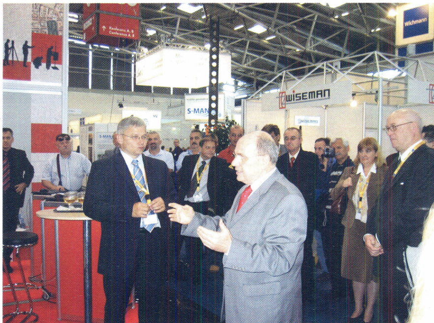
Slika 4. Generalni konzul Republike Hrvatske u Münchenu Zvonko Plećaš pozdravlja prisutne.