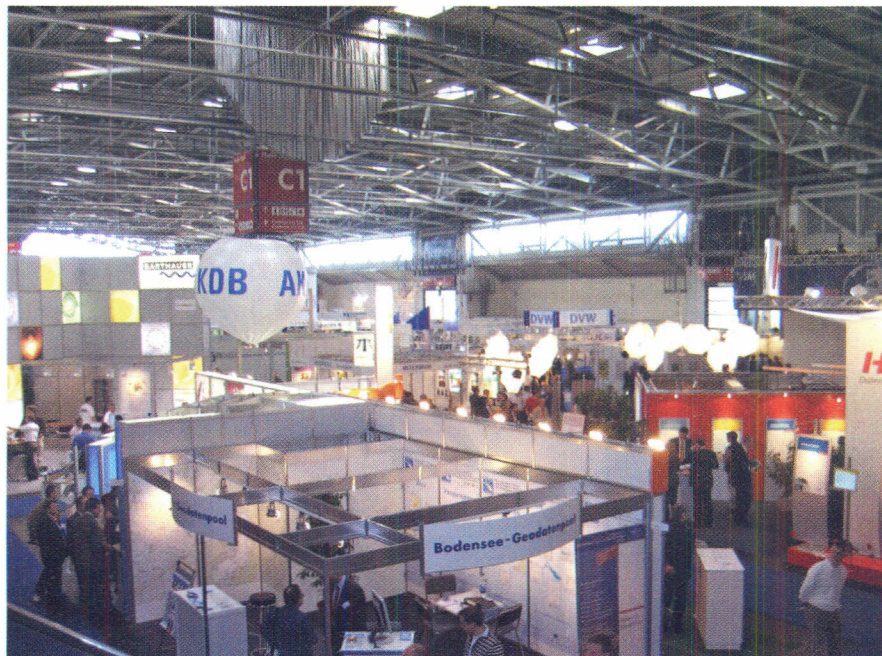
Slika 2. Pogled na jednu od dvorana sajma.