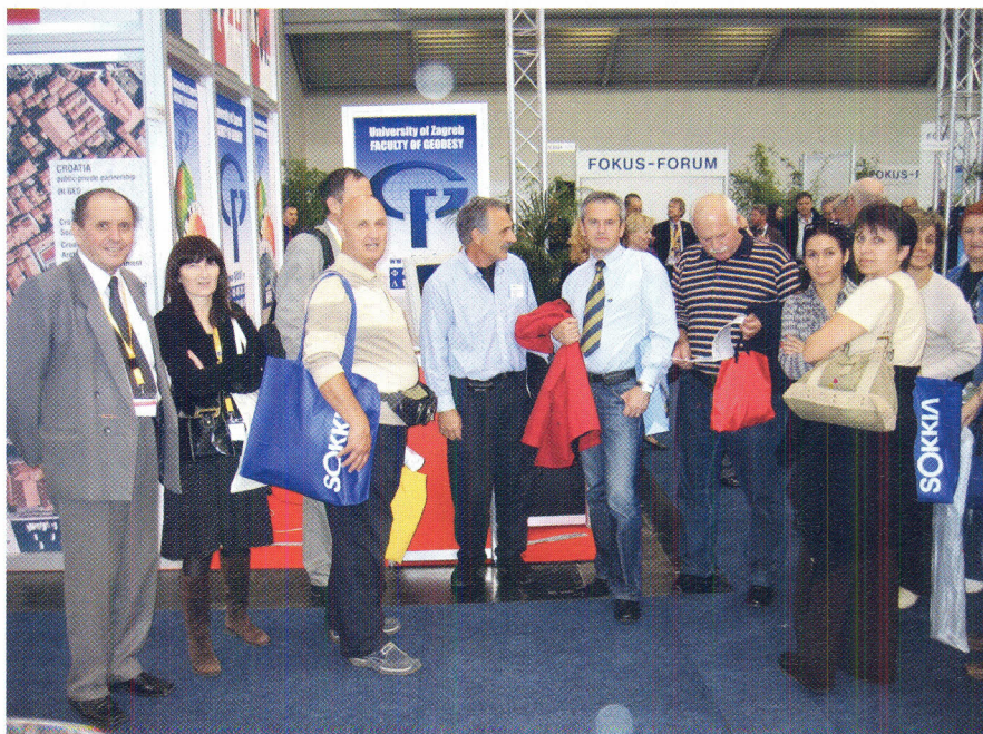
Slika 5. Dio sudionika na hrvatskom štandu.