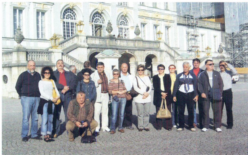
Slika 6. Članovi predsjedništva HGD-a pred dvorcem Nymphenburg.

nu Ratskeller na Marienplatzu. Tradicionalan restoran smješten u podrumu gradske vijećnice, jedinstvenog ugođaja sa bavarskim specijalitetima okrijepio nam je dušu i tijelo nakon napornog dana.